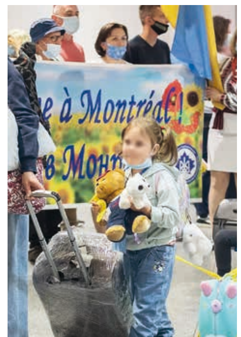
Accueil des réfugiés ukrainiens au Canada